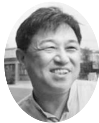
札幌医科大学教授