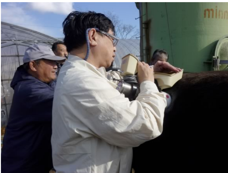
福島第一20km圏浪江町での牛のセシウム検査を行う筆者、2012年2月4日。暫定基準値以下の牛もいることが分かった。除染すれば、酪農再建は可能である。

圏内の瓦礫とともに、沿岸およそ40kmの範囲を埋め立てて、堤防公園化するのである。これは、昨年10月に、現地いわき市での勉強会に講師として呼ばれた際に提案し、多くの参加者に賛同された。その後、総理官邸にもメールで提言している。大正時代の関東大震災で、横浜市は、6万戸分の瓦礫で海岸を埋め立て山下公園を建設した。平成の日本に、福島40km堤防公園は建設できるはずだ。完成後には、福島復興を記念し国際マラソンを行なう。世界に日本の科学力と強い意思を示すべきだ。